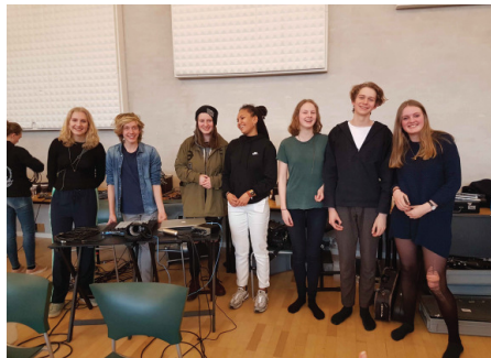
På billedet ses de medvirkende elever fra Gentofte Musikskole (fra venstre):